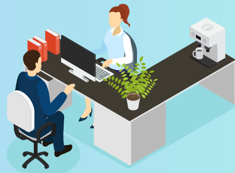
ยกระดับการให้บริการ ประชาชนผ่านศูนย์บริการร่วม (One Stop Service)