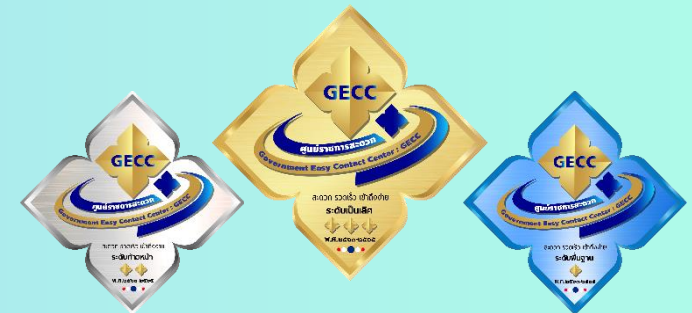
มุ่งเน้นคุณภาพการให้บริการตาม มาตรฐานศูนย์ราชการสะดวก (GECC)