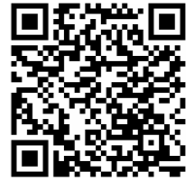
ดาวน์โหลดแผนภาพต้นฉบับ