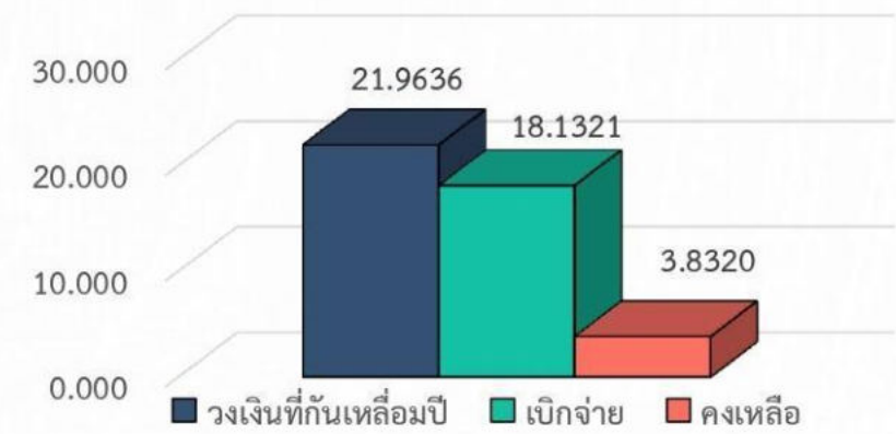
หน่วย : ล้านบาท